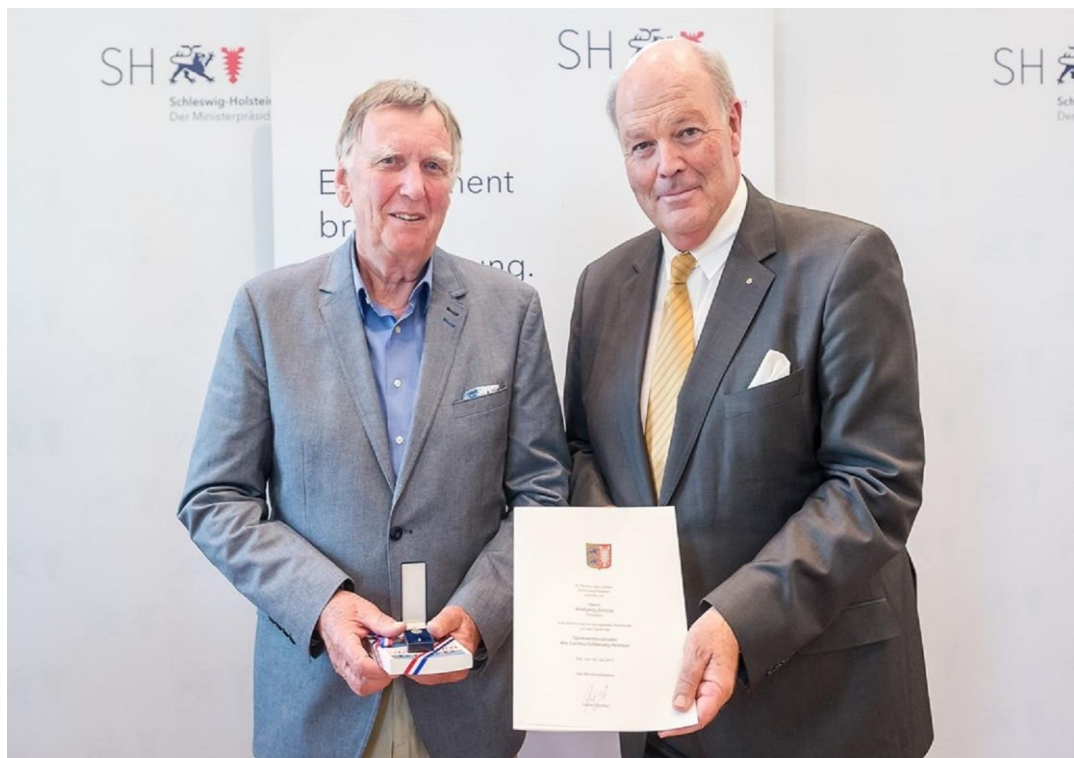
(Empfang der Ehrennadel des Landes SH 2017)

Der TSV möchte diesen Zeitpunkt nochmals zum Anlass nehmen, Dir für Dein unermüdliches Wirken rund um den Handball zu danken. Du hast durch Dein ehrenamtliches Engagement maßgeblich zum Erfolg des Handballs im TSV OWW beigetragen und das wird bleiben und immer mit Deinem Namen verbunden sein. Der TSV wünscht Dir für Deinen weiteren Lebensweg alles erdenklich Gute und wir hoffen natürlich, dass wir Dich auch weiterhin auch an der „Bandes des Handballs“ antreffen.