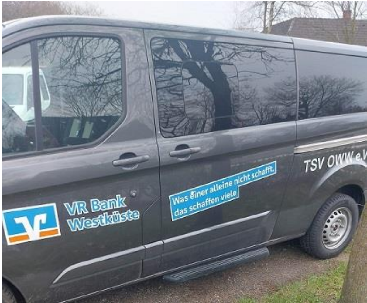
Unser neuer Vereinsbus

Ich freue mich über das Interesse an unserem Verein und wünsche viel Spaß beim Lesen unseres Berichtshefts.