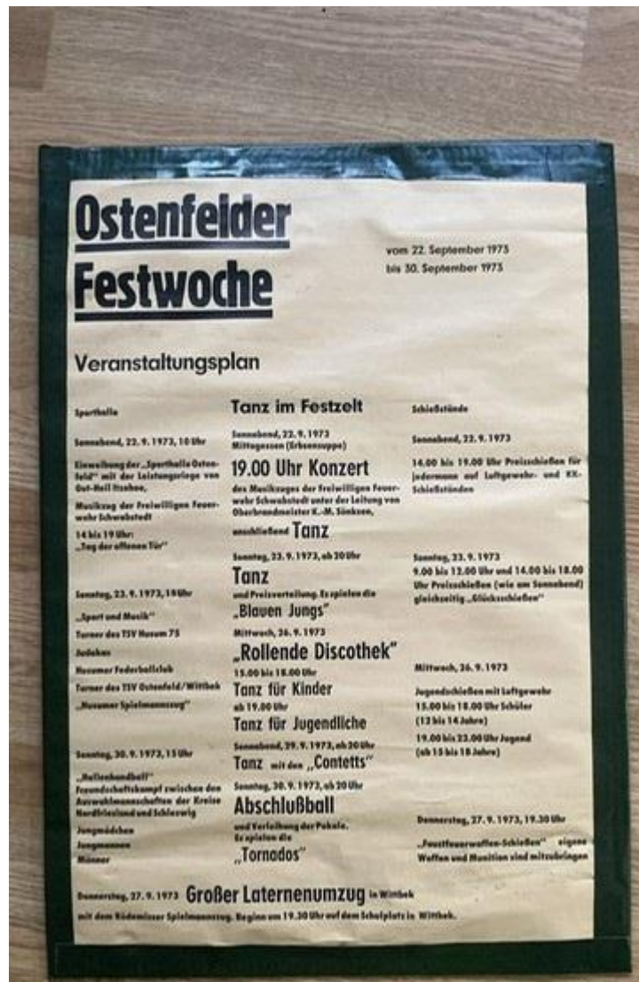
(ein für die damalige Zeit ansehnliches Festprogramm)

Im September 1973 wurde sie im Rahmen einer Festwoche eingeweiht. Gut 1,5 Millionen Euro wurden 2015/2016 in die Modernisierung investiert, die Einweihung wurde im März 2016 gefeiert. Na wenn das kein besonderes Ereignis ist.