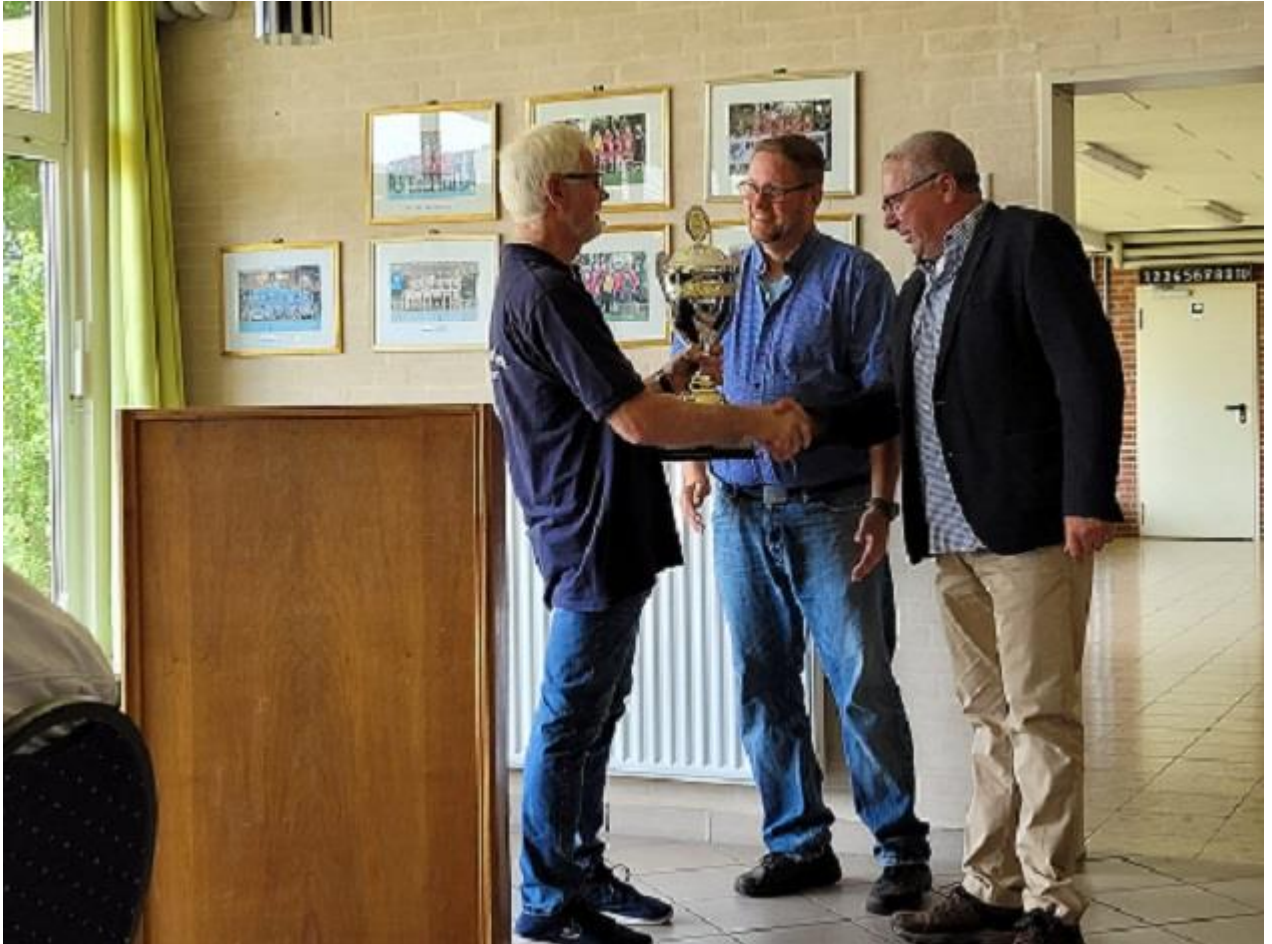
(Der Verein Umwelt, Kultur und Geschichte macht den 1. Platz)

Die Mitgliederzahl bei uns ist weiterhin stabil bei ca. Mitte 70 Personen. Aus sportlicher Sicht war das Jahr 2023 für uns wieder sehr erfolgreich. Im März 2023 haben wir mit 15 Schützen, mit insgesamt 60 Starts, an der Kreismeisterschaft teilgenommen. Hier haben wir in der Einzelwertung 29x Platz 1, 12x Platz 2 und 7x Platz 3 erreicht. In der Mannschaftswertung erreichten wir 8x Platz 1, 3x Platz 2.